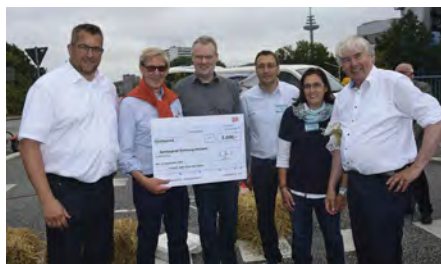
Scheckübergabe Autokraft GmbH