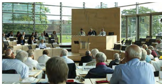
Das Altenparlament bei seiner Sitzung am 16.9. 2016 im Schleswig-Holsteinischen Landtag.