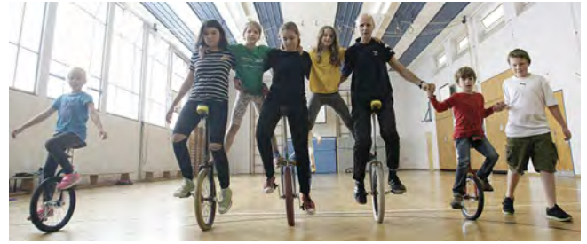
„Schule und Verein“ - Einradfahren mit dem Kieler TB an der Kieler Gelehrtenschule. Neben dem KTB gehören auch der TSV Kronshagen, der TSV Russee und die SV Friedrichsort der Einrad-AG Kiel/Kronshagen an.