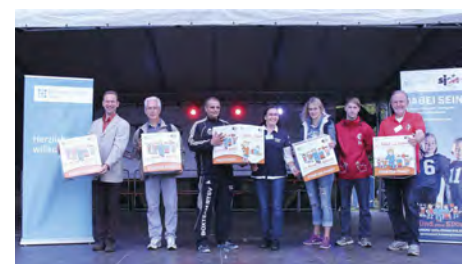
Verleihung der Starter-Pakete