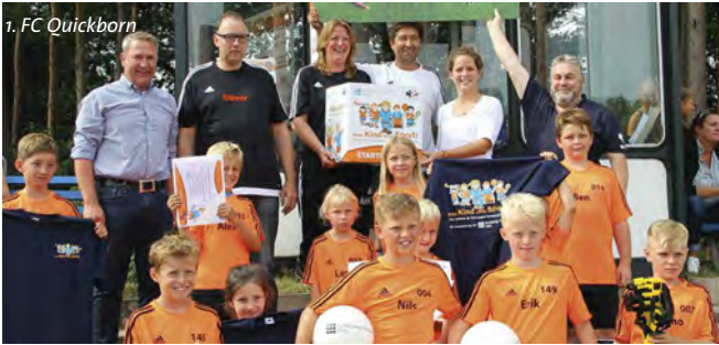
1. FC Quickborn