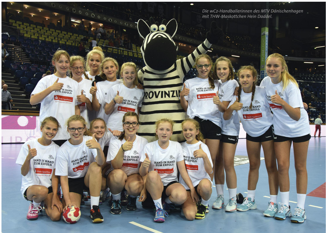
Die wC2-Handballerinnen des MTV Dänischenhagen mit THW-Maskottchen Hein Daddel.